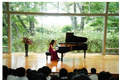
ステパノでの歩みを通して